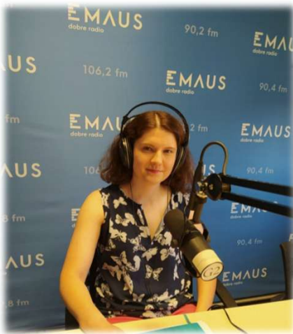
➤ Działania medialne