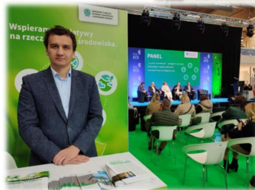
➤ Obsługa stoisk informacyjno-promocyjnych