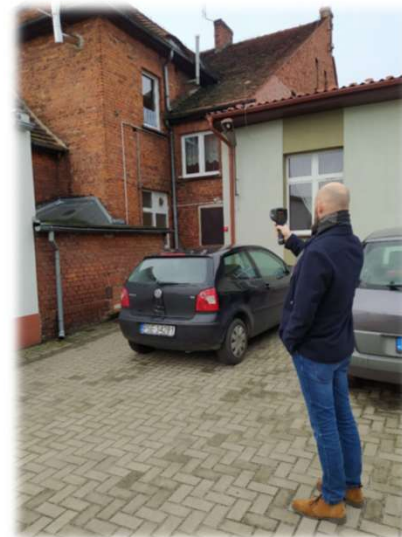
➤ Badania termowizyjne