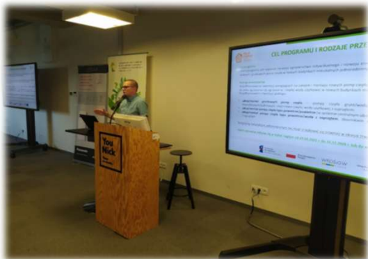
➤ Konferencje i szkolenia